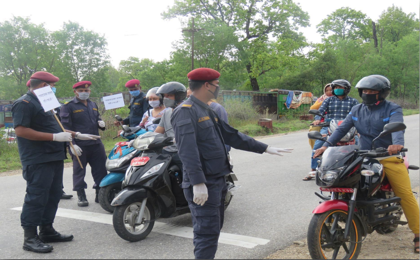
सुरक्षाकर्मीहरूद्वारा सचेतनामूलक प्लेकार्ड सहित सवारी पास चेक गरिदैं ।